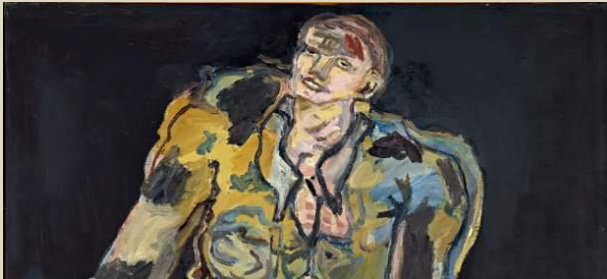
REBELDES: 1965- Óleo sobre lienzo. 162x130cm.

Georg Baselitz (Sajonia Occidental 1938). Artista alemán que siempre se sintió fuera de lugar. Con 27 años dio vida a la serie Los Héroes caídos, entre 1965 i 1967.