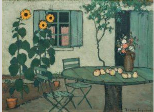
Girasoles, 1909. Colección particular

Nacido en Barcelona vive en París. Su pintura de tendencia naïf mantiene una unidad a lo largo de su obra. Privilegia los espacios interiores o recoletos que en general carecen de figuras humanas y que a menudo crean sensaciones de desasosiego. Siendo pintor su labor principal era la de ilustrador, en especial el área infantil.