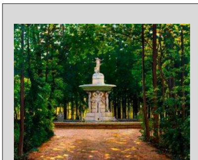
La fuente de Narciso, II. Jardines de Aranjuez

Otra muestra excepcional es la que organiza el Museu del Modernisme que reúne muchos de los lienzos que Rusiñol presentó en París en 1890. Más tarde los compilaría en su libro-joya "Jardines de España" con poemas de Machado, Maragall, Azorín, Juan Ramón Jiménez o Mestres, entre otros.